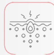
Minskning av inflammationer