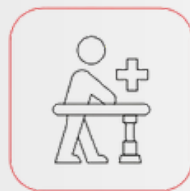
Rehabilitering efter kirurgi