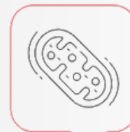
Förbättrade mitokondriella funktioner