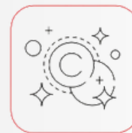
Ökad produktion av kollagen och elastin