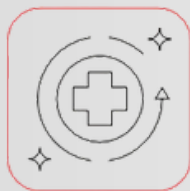
Förbättrad återhämtning efter träning