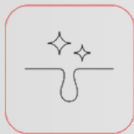
Reducerad porstorlek i huden