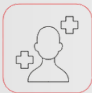
Förbättrad läkning av skador