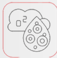
Ökad syresättning av vävnader